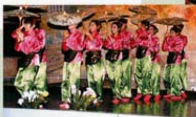
舞蹈員演出投入，笑容燦爛。