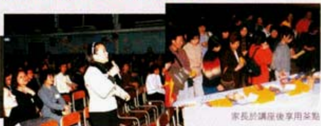
家長於講座後享用茶點