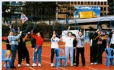
家長與子女一起參加親子競技比賽。