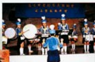
敲擊樂隊銀樂隊聚精會神地演奏。