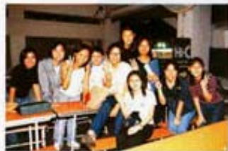
舊生重聚，大家興奮不已。