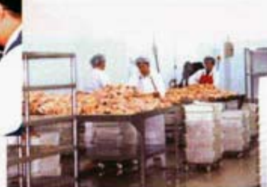
食品工場環境清潔。