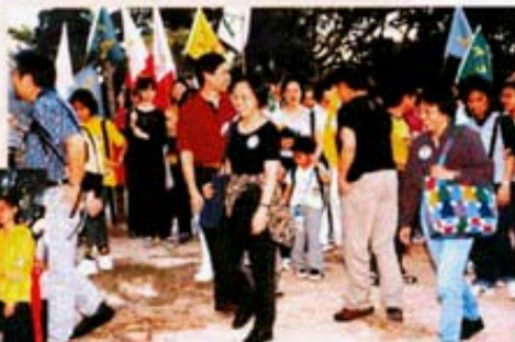
家長、學生精神抖擻，齊齊參與籌款活動。