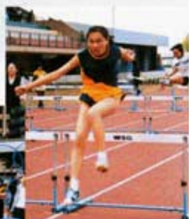
運動健兒身手敏捷，動作姿態美妙。