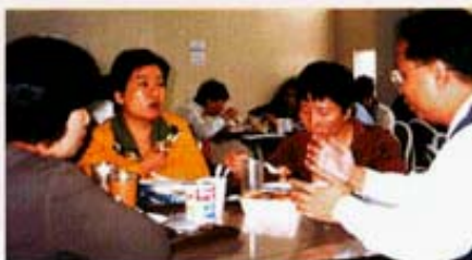
家長討論食物的營養及味道。