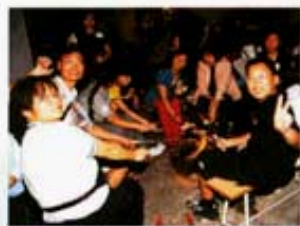
家長、教師、學生打成一片，共渡燒烤晚會。