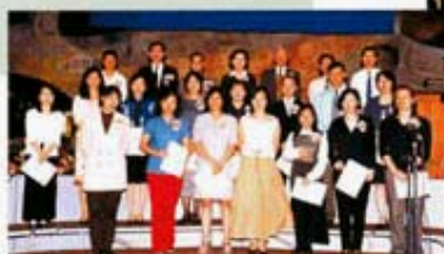
家長教師會委員與主禮嘉賓合照。