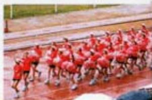
四社啦啦隊隊員演出不同圖案。